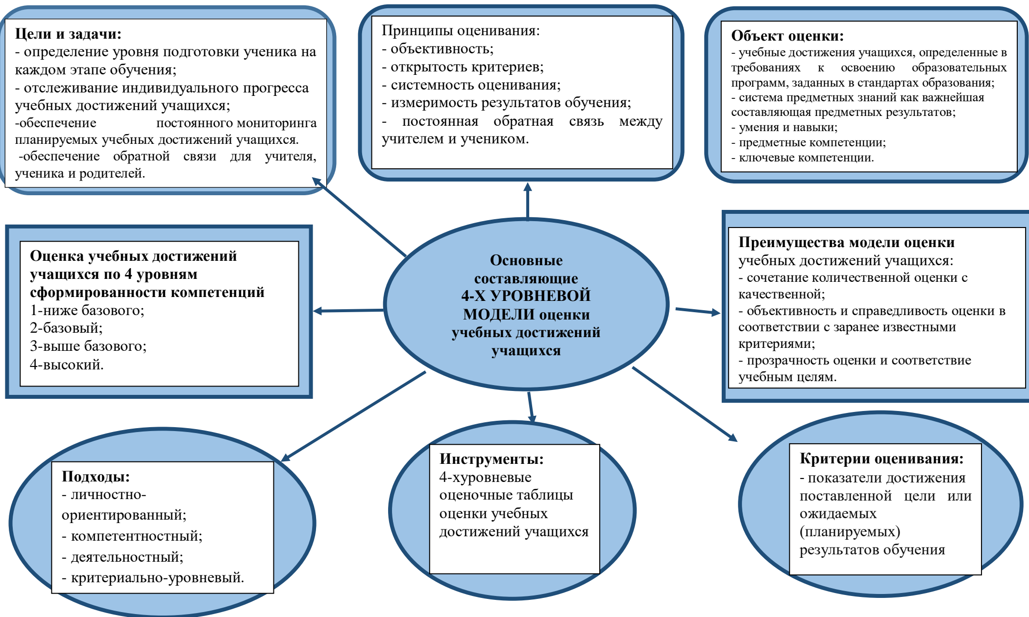
Современная 4-хуровневая модель оценки учебных достижений учащихся (Рисунок 2)